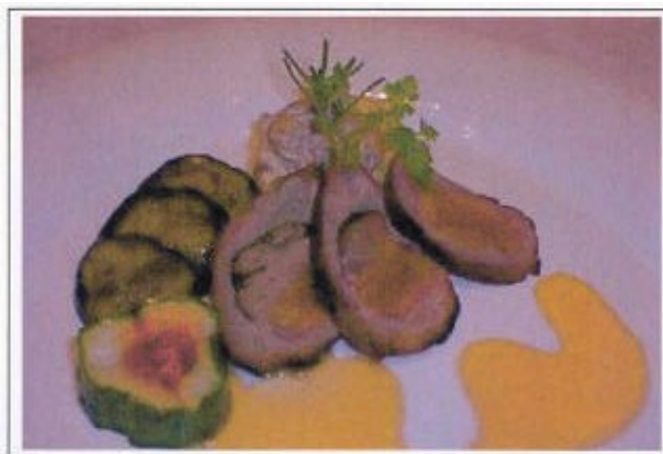
Poitrine de canard farcie de foie de volaille, légumes du panier