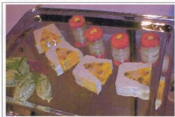
Terrine de poissons farcie avec St-Jacques et moules