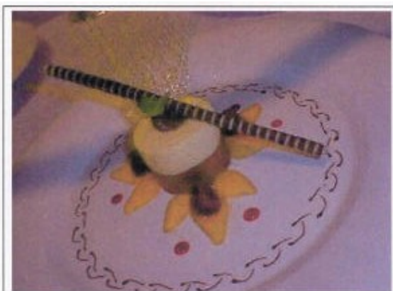
Mousse aux deux chocolats